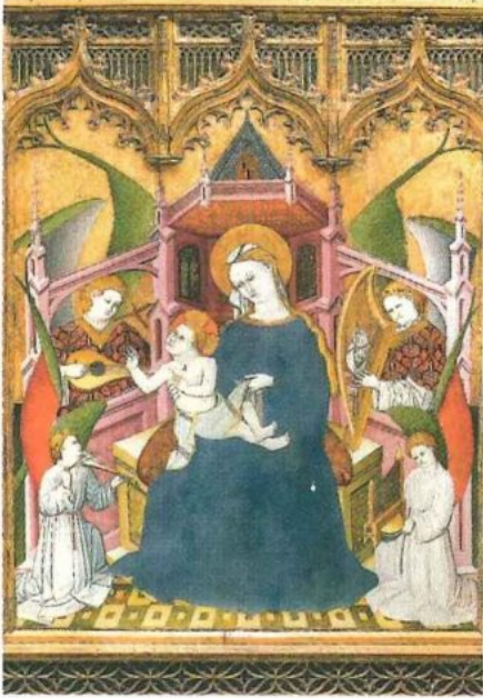
Virgen con el Niño. Tabla central del Retablo de la Vida de la Virgen y de San Francisco. Museo Nacional del Prado. Madrid.